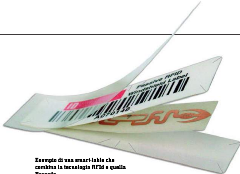
Esempio di una smart-label che combina la tecnologia RFID e quella Barcode

inferiori al metro) il costo si attesta al di sotto dei 500 € e, per i modelli più semplici, può scendere fino a poco più di 100 €. I reader più complessi possono permettere la lettura dei tag fino ad una distanza di 15 metri e il prezzo generalmente è variabile tra i 1.000 ed i 3.000 €, a seconda delle caratteristiche del componente. Nel caso si opti per l'utilizzo di tag attivi ovviamente il prezzo lievita anche se, generalmente, l'unica voce di costo a variare è quella relativa all'acquisto dei tag stessi. Dai calcoli svolti per un'azienda di medie dimensioni caratterizzata da un alto numero di elementi da identificare, il costo dei materiali necessari all'implementazione di un'architettura RFID si aggira attorno ai 40.000 €. A questo importo vanno aggiunti i costi necessari alla prima installazione e, negli anni successivi, quelli relativi alle attività di manutenzione e di sostituzione dei componenti. In realtà produttive caratterizzate da alti ritmi produttivi ed un'alta saturazione dei macchinari, il tempo risparmiato permetterebbe di recuperare tempi di stand-by riutilizzabili a fini produttivi. Il payback time, in situazioni di questo genere, risulta essere molto ridotto, anche dell'ordine di (soli) 6 mesi.